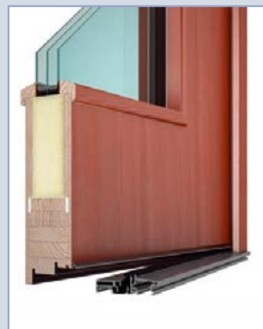
Türsystem Trend 94

* beim Glas U_w = 0,5 \text{ W/m}^2\text{K}