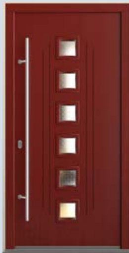
MARTINA 2 D1